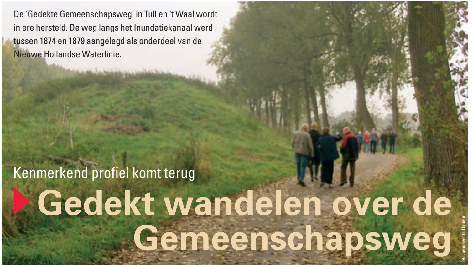
De aarden wal is in de loop van de tijd 'verwilderd'.

Met projecten zoals het herstel van de weg willen we dit deel van de Nieuwe Hollandse Waterlinie weer herkenbaar, leefbaar en toegankelijk maken. Onlangs werden in dit kader de baggerwerkzaamheden en de munitieruiming van het Inundatiekanaal en de omliggende fortgrachten succesvol